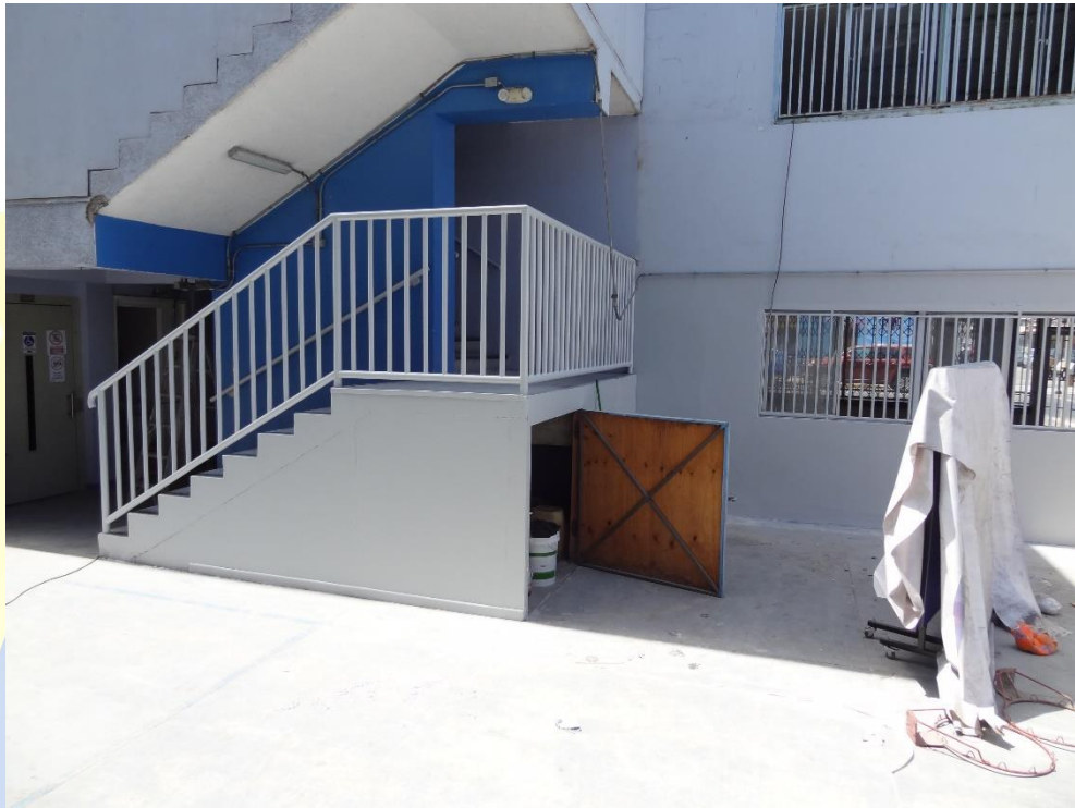
Adaptaciones La Colmena